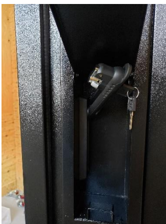
レバーを手前上いっぱい迄引き上げると扉が少し空きます