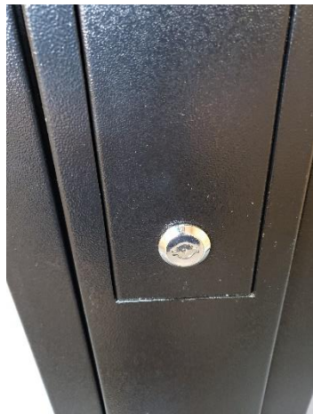
鍵の差込口は側面にあります