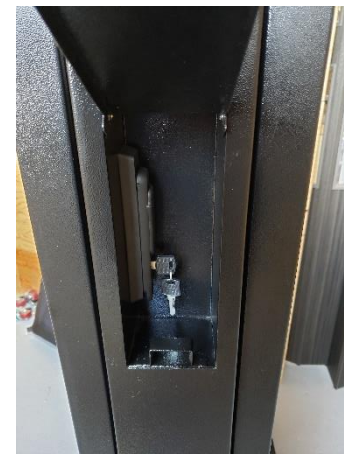
扉用鍵付きレバーがあります