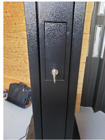
鍵はキッチリと奥まで差し込んで回します