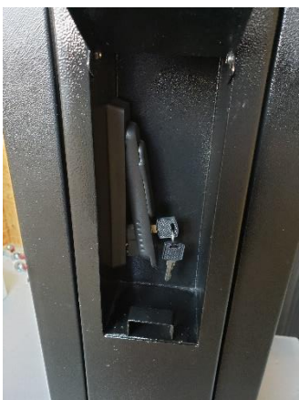
鍵を回し左に引きます