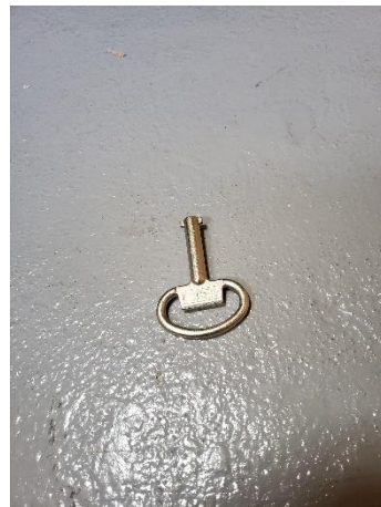
鍵はこちらのタイプ